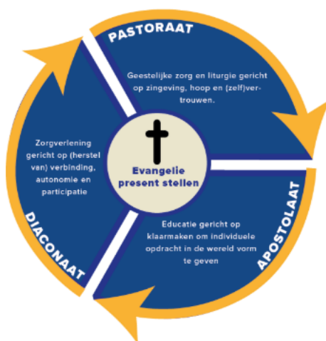
Figuur 1. Vanuit de centrale missie biedt OZ100 diaconaat, pastoraat en apostolaat.

Vanuit de oude kerkelijke traditie noemen we dit ook wel diaconaat, pastoraat en apostolaat. Wij zijn hier om te luisteren naar de vragen en behoeftes van mensen die op andere plekken geen helper vinden. Samen zoeken we naar mogelijkheden, vormen we een thuis, vangen we op en helpen we overeind. Zo bieden we zorgverlening op maat, flexibel aangepast aan de bewegingen en behoeftes in de maatschappij.